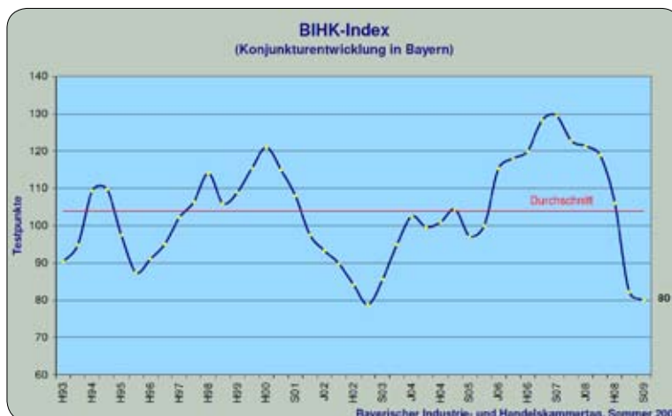
Die bayerische Konjunkturentwicklung zeigt seit Sommer 2007 steil nach unten.

Proteste und Gegenwehr werden spätestens nach der Wahl immer notwendiger, damit die Kosten der Krise nicht weiterhin auf dem Rücken der Beschäftigten abgeladen wird. Mit Forderungen nach einem gesetzlichen Mindestlohn, dem Ausbau der Mitbestimmung, der Umwandlung von Leiharbeit in reguläre Arbeitsverhältnisse, der Verlängerung des Bezugs von Arbeitslosengeld I und der sofortigen Anhebung des Hartz IV-Regelsatzes unterstützt DIE LINKE diese Gegenwehr. Das Anliegen der Betroffenen muss in die Parlamente und auf die Straße getragen werden. ◀