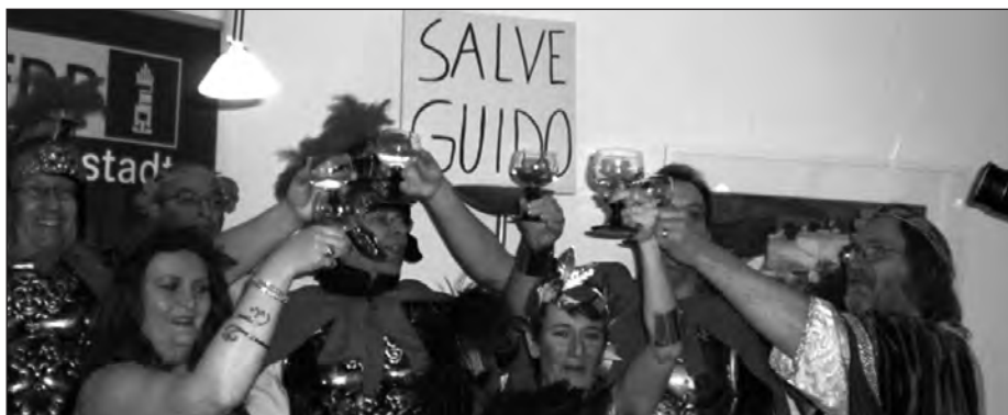
Foto: Dekadente Römer der Gewerkschaftlichen Arbeitsloseninitiative Darmstadt besuchten am 3. März die FDP-Geschäftsstelle in Darmstadt.

Herr Westerwelle meint, der Sozialstaat sei überfordert. Stimmt das? Nach dem Haushaltsentwurf 2010 der Bundesregierung sollen angeblich insgesamt 176,7 Milliarden Euro für soziale Zwecke ausgegeben werden. Das ist mehr als die Hälfte des gesamten Haushalts. Das betrachtet die Regierung als Ausweis ihrer sozialen Politik. Doch genau das Gegenteil ist der Fall: Diese extrem hohen Ausgaben sind ein Warnsignal!